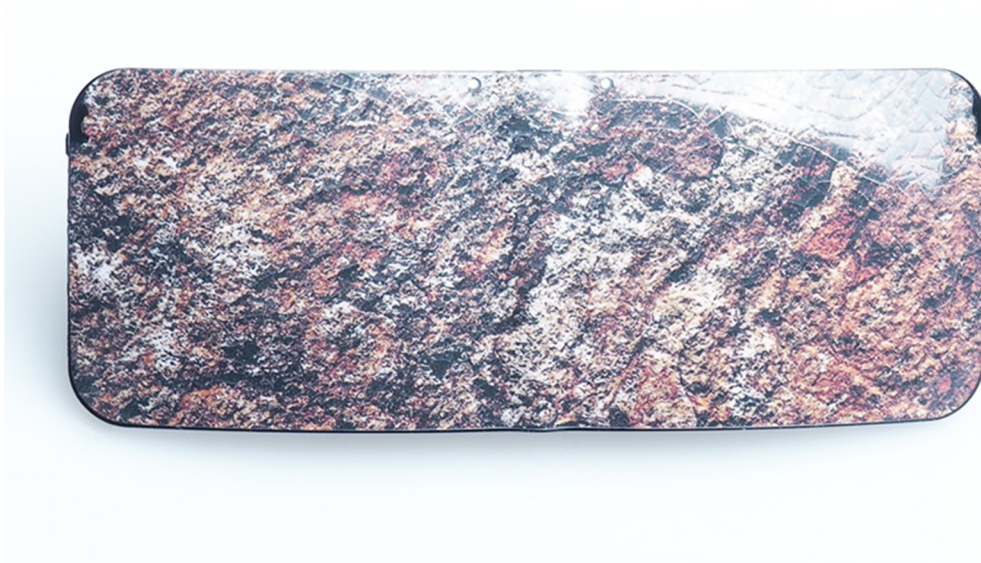
Bildunterschrift: IMPLEX Vorformling auf Basis von TROGAMID®.

das Produkt-Knowhow; als fachkundiger Partner steht Tungsung für die Herstellung von besonderen Brillengestellen.